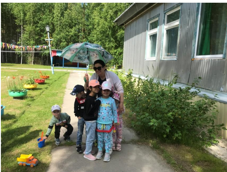
Воспитатели группы «Сказка»